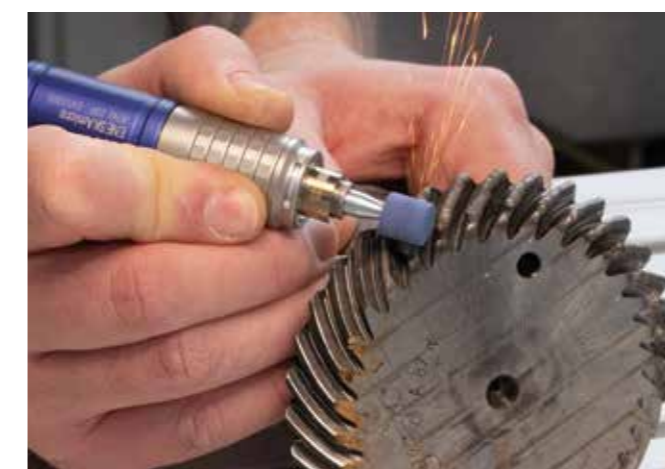
Schweißnaht mit Schleifstift Blue Stones