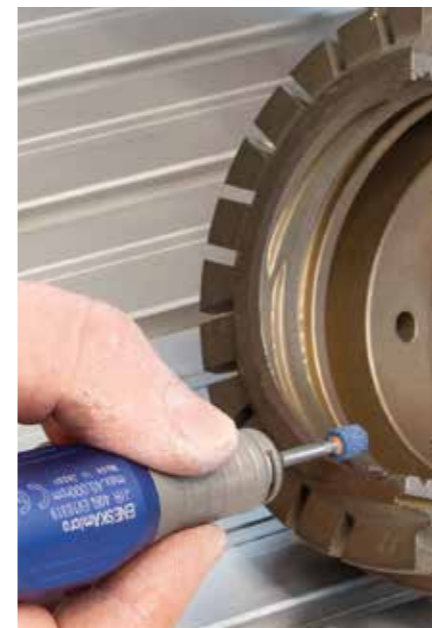
oben: Reduziergetriebe mit Handstück | unten: extra langes Handstück mit Diamant-Schleifstift