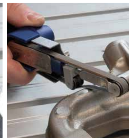
Polierholz mit Diamantpaste und Handfeilmaschine